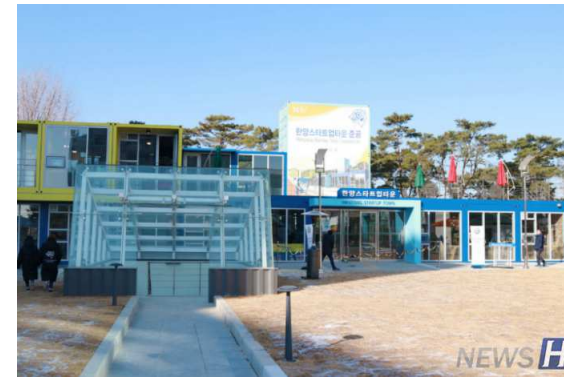
Hanyang Start-up Town