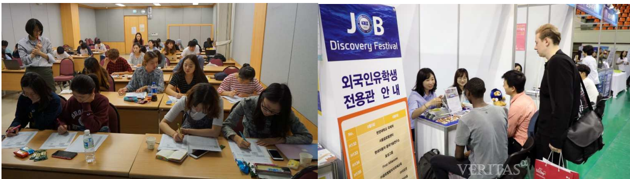
留学生职业能力倾向测试