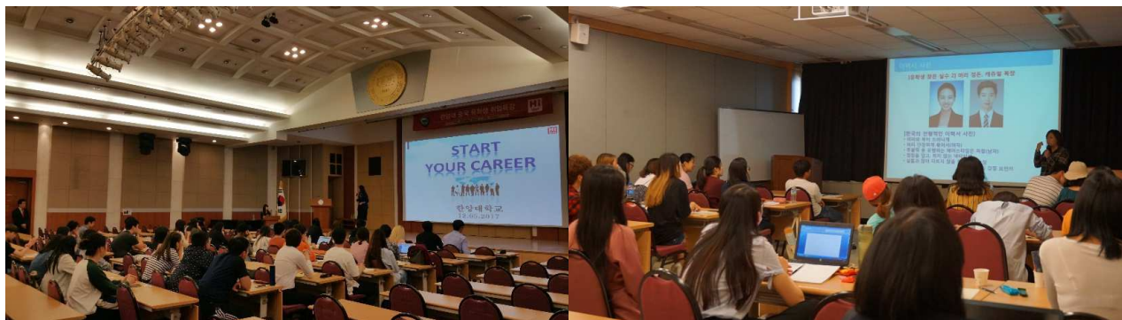
针对留学生的就业培训