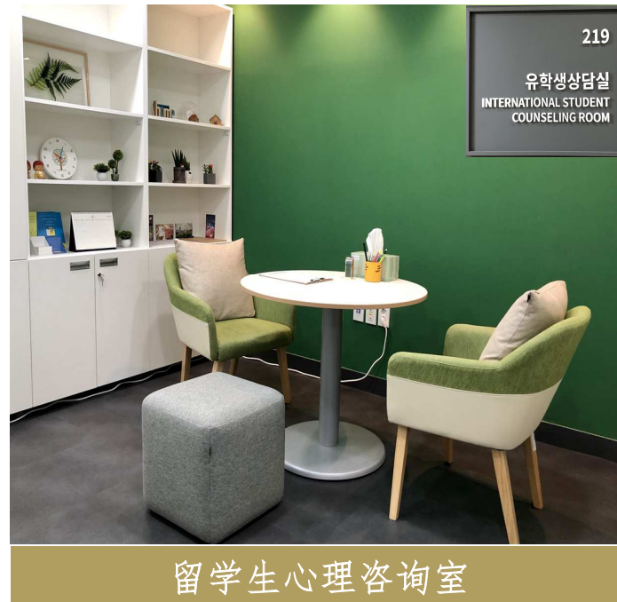
留学生心理咨询室